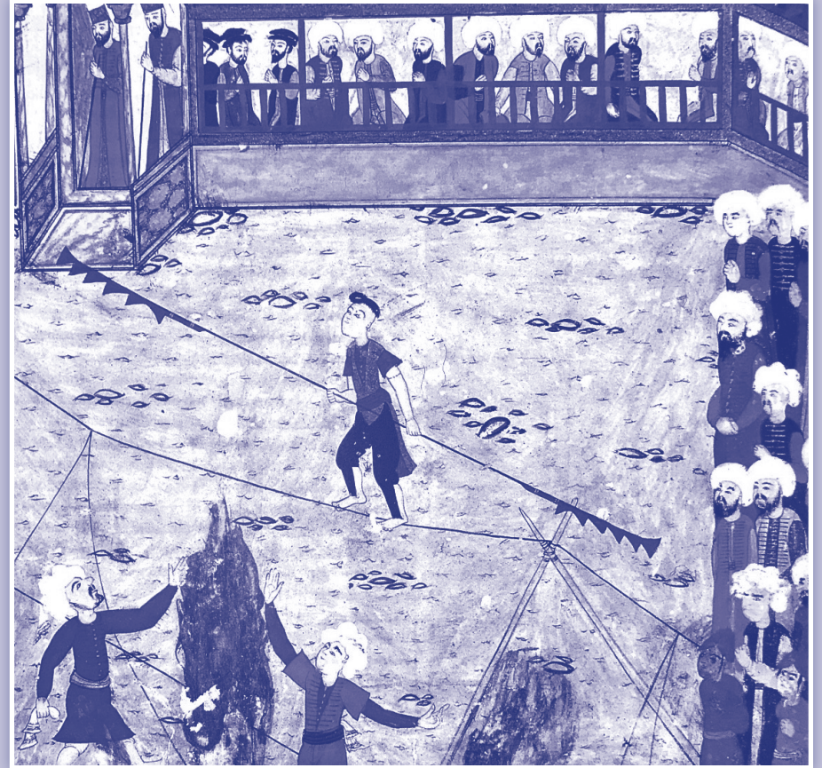
İntizâmî'ye ait minyatürde 1582 yılında ip cambazları gösteri yaparken görülüyor.

Eski zamanlarda gün görmüş bir kadının yakışıklı boylu poslu güzel mi güzel bir oğulcuğu varmış. Oğlanın işi gücü olmadığı için onu saraya padişahın emrine vermiş. Günün birinde padişah sarayı dolaşırken hizmetçilerine: